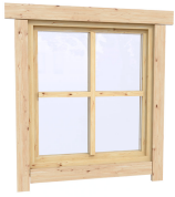
0.87×0.78 м.1 шт.