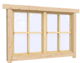
1.34×0.91 м.1 шт.