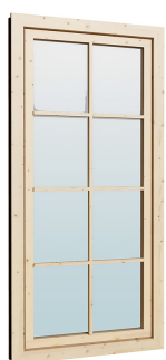
0.84×1.885 м.3 шт.