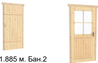
0.84×1.885 м. Бан.2 шт. 0.84×1.885 м. Остекл.1 шт.

7. Наличники: сухая строганная доска 20×100 мм.;